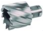
Кольцевые фрезы по металлу