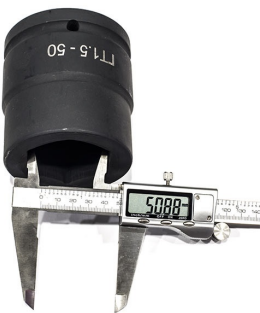
Головка торцевая ударная для гидравлического гайковерта под гайку 50мм

Сформировано 17.04.2026 17:21 · KRATONSHOP.RU