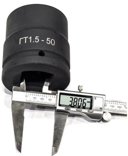
Головка торцевая ударная для гидравлического гайковерта под приводной квадрат 1.5" (т.е. 38мм)