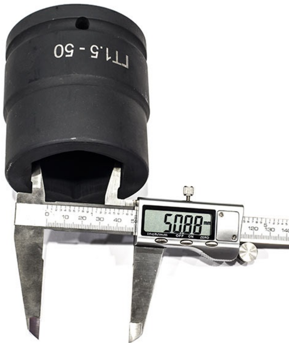
Головка торцевая ударная для гидравлического гайковерта под гайку 50мм

Сформировано 08.01.2026 11:48 · KRATONSHOP.RU