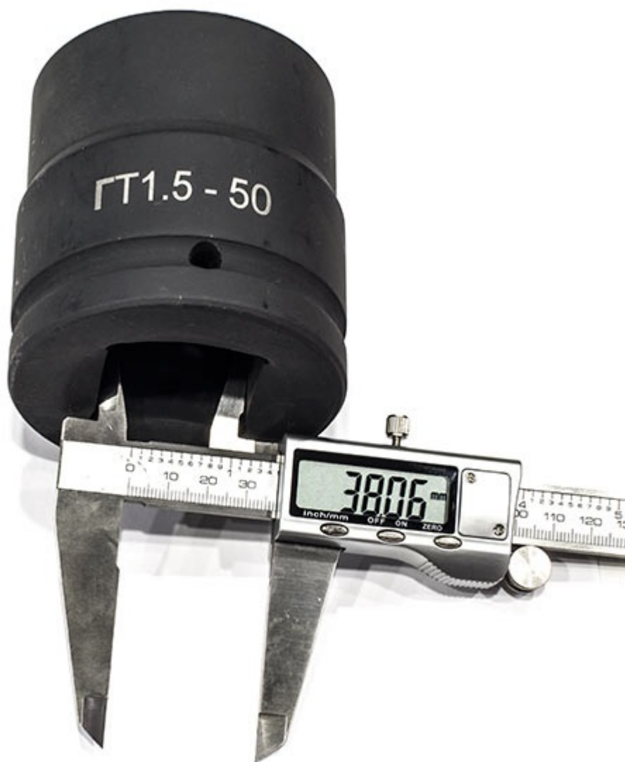
Головка торцевая ударная для гидравлического гайковерта под приводной квадрат 1.5" (т.е. 38мм)