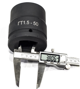
Головка торцевая ударная для гидравлического гайковерта под приводной квадрат 1.5" (т.е. 38мм)