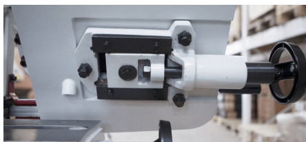
Гибка углов; квадрат 12 x 12; полоса 40 x 6; пруток 12

Сформировано 17.04.2026 13:14 · KRATONSHOP.RU