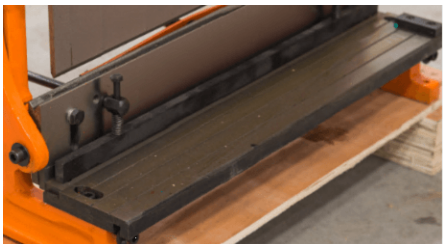
Рабочий стол для гильотины + направляющая для листа для резки под углом 90°