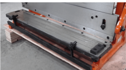
Отшлифованные ножи для резки (поворотные для удвоенного срока службы)

Просвет гильотинных ножей – от 2мм до 18мм