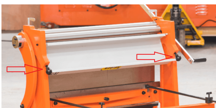
Ручки подъѐма заднего вала