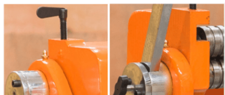
Кривошипы подлежат смазке смазочным шприцем по мере необходимости