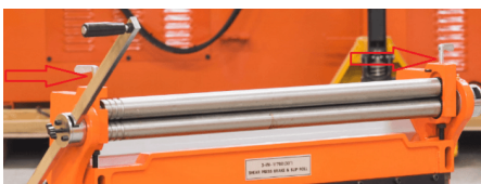
Ручки фиксации верхнего вала