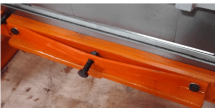
Система регулировки антипрогиба матрицы исключая прогиб