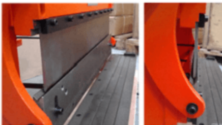
Высота сегментов – 103мм, глубина матрицы (входа пуансона в матрицу) – 10мм