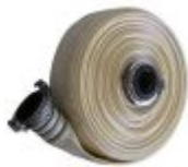
Рукава для мотопомп

Мотопомпа Huter MP 50 - предназначена для перекачивания больших объемов жидкости. Благодаря бензиновому двигателю агрегат не зависим от электрической сети. Топливный бак, рассчитанный на 3.6 л, гарантирует продолжительную работу без прерывания для дозаправки. Благодаря металлической раме механизм мотопомпы защищен от повреждений. Для продолжительного срока службы в конструкции применяются качественные надежные материалы.