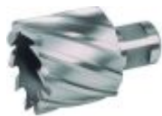
Кольцевые фрезы по металлу