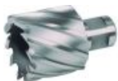
Кольцевые фрезы по металлу