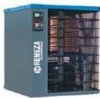
RFD21 – RFD101