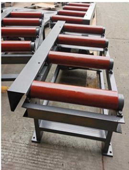
Механический подающий рольганг длиной 1500 мм и шириной 650 мм (в стандартной комплектации)