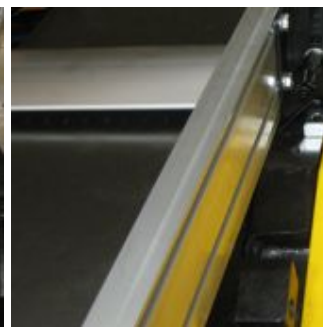
Направляющая планка имеет наклон до 45гр