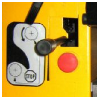
В режиме строгания предусмотрено отключение протяжных роликов.