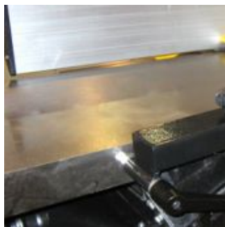
На рабочий вал установлено 4 ножа.