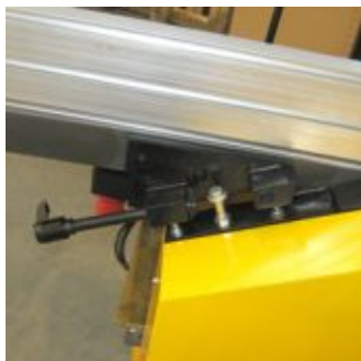
Быстрый и удобный переход из режима строгального станка в режим рейсмуса.