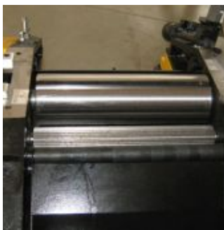
Пильный узел имеет подрезной диск для распила ЛДСП