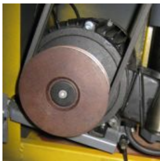
Мощный двигатель с питанием от сети 380 В.