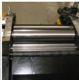
Пильный узел имеет подрезной диск для распила ЛДСП