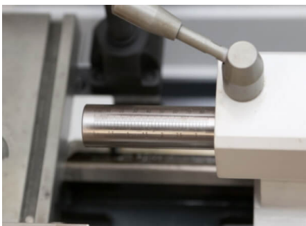
Вылет пиноли задней бабки 60 мм