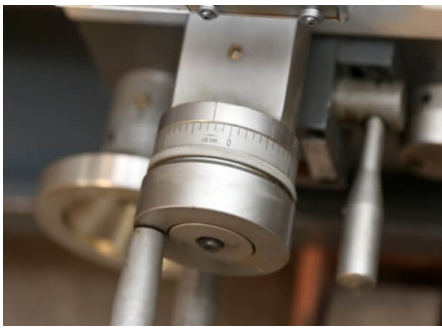
Цена деления лимба поперечной подачи – 0,1мм.