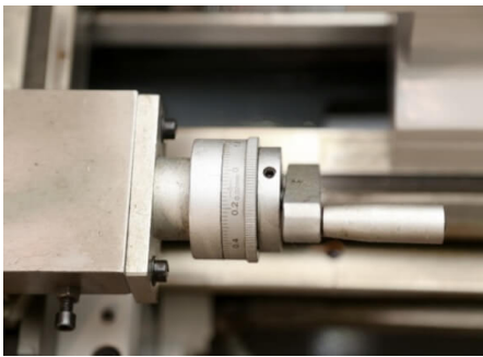
Цена деления лимба тонкой продольной подачи - 0.02 мм