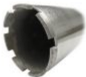
Алмазные коронки для бурения

Сформировано 03.04.2026 19:36 · KRATONSHOP.RU