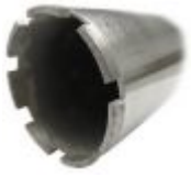
Алмазные коронки для бурения

организации по безопасности шлиф. инструмента «OSA», где принимает активное участие. Это позволяет быть в курсе последних норм и систем контроля. Таким образом к покупателю попадает современная, высококачественная и безопасная продукция. Сегодня Dr.Schulze надежный помощник в области распиловки твердых пород, позволяет решать неограниченные задачи для проведения самых сложных работ.