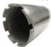
Алмазные коронки для бурения