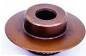
Диски для труборезов

Сформировано 10.01.2026 06:10 · KRATONSHOP.RU